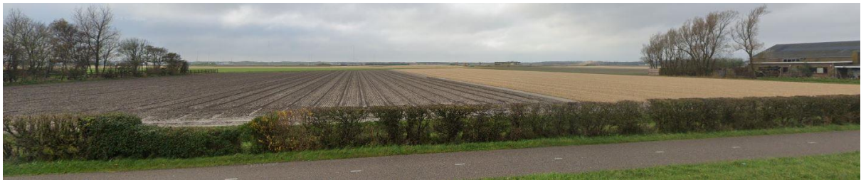
Afbeelding: Vooraanzicht vanaf de doorgaande Nieuweweg.